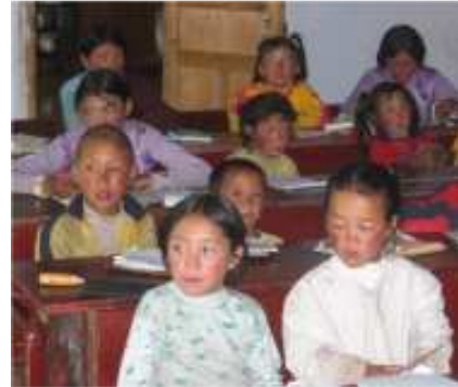
Figure 6: Une classe de Dzogchen en 2005