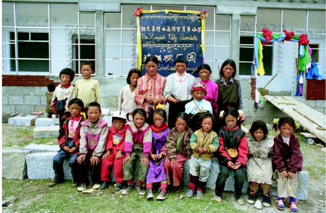
Figure 5: inauguration de l'école, les premiers élèves