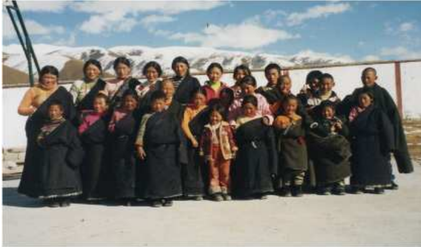
Figure 8: les élèves de Dzogchen , hiver 2005