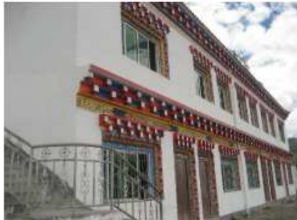
Figure 7: En 2005, construction de logement pour les enseignants