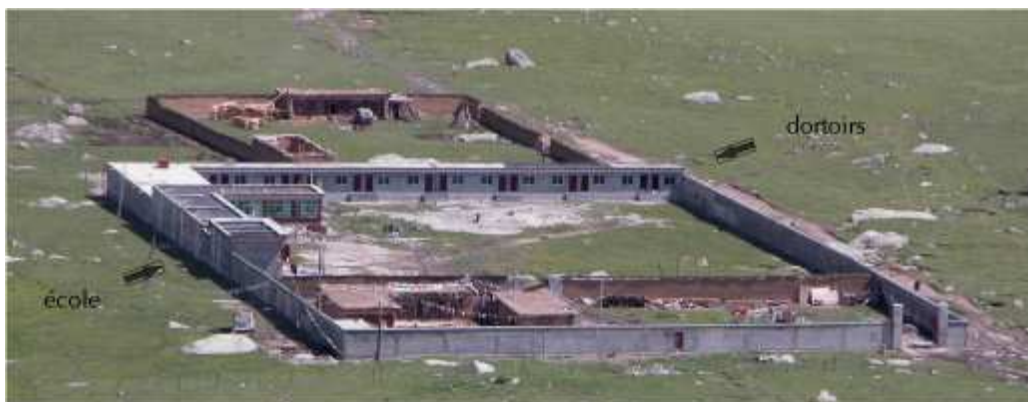
Figure 4: Vue d'ensemble de l'école avec les dortoirs en 2003