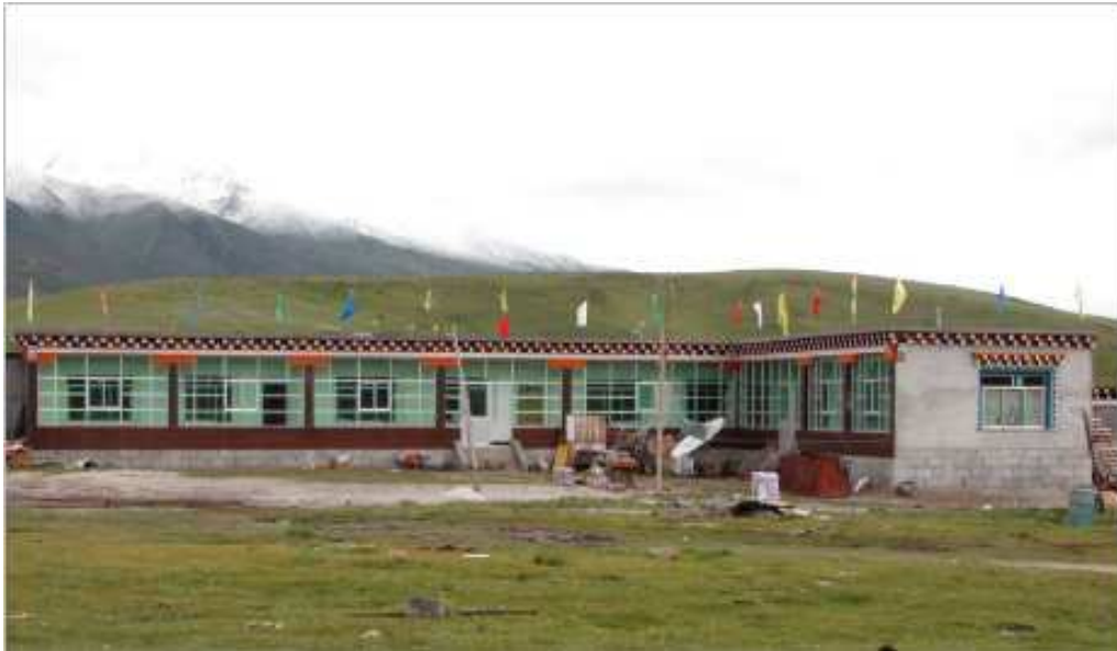
Figure 3: L'école a ouvert ses portes en août 2002

La bibliothèque de l'école a pu être construite grâce à l'aide financière de la Swedish Tibetan Society for School and Culture, une ONG suédoise qui a déjà construit ou rénové 108 écoles à travers le Tibet. ( www.tibet-school.org )