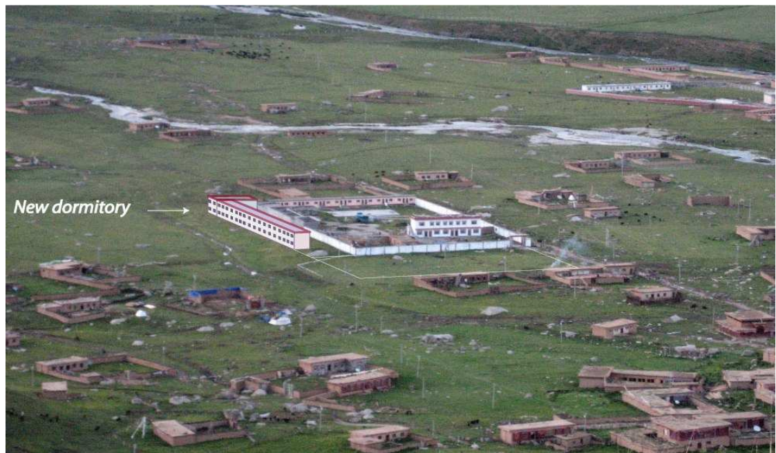
Figure 1: Emplacement de l'extension par rapport aux bâtiments existants

Dès le mois de mars 2006, nous nous sommes attelés à la conception d'un premier avant-projet d'extension des bâtiments de l'école: une aile de deux étages, mêlant harmonieusement salles de classes, chambres et bureaux.